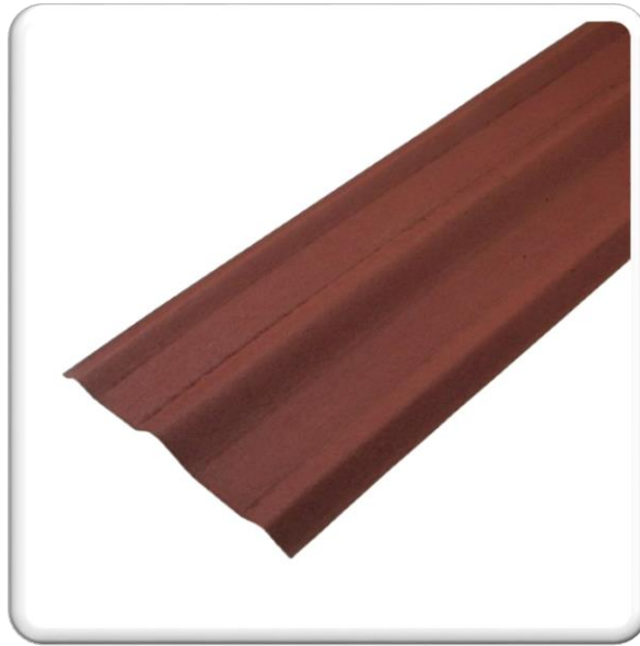
CUMIEIRA ONDULINE CORES; VERDE, VERMELHO E MARROM MEDIDA; 2,00 X 0,60 CM