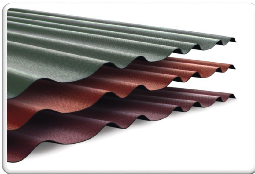
TELHA ONDULINE DESIGN DUO