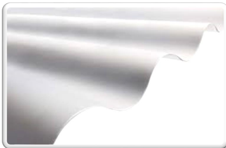
TELHA LEITOSA TILETRON ONDA ALTA MEDIDA; 2,44 X 1,10