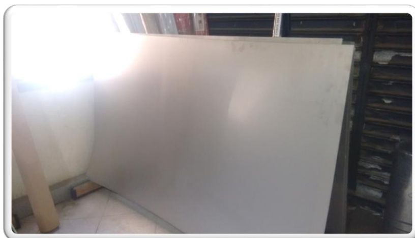
CHAPA INOX FOSCA T-304